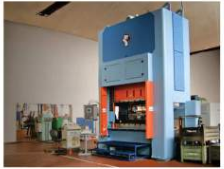
Lisování - stříhání a hohybání, hluboké tažení a protlačování