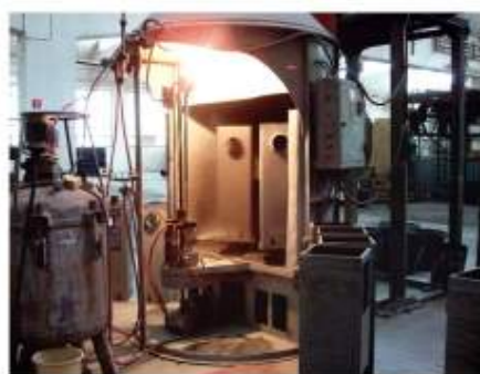
Pískování povrchu, galvanické pokovování a smaltování