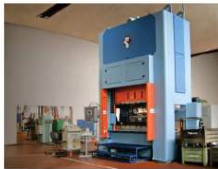
Lisování - stříhání a hohybání, hluboké tažení a protlačování