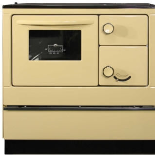
THORMA OKONOM 85 FIKO De Luxe - Levý