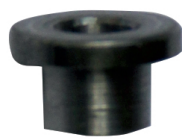
Podložka pro kličku s osazením 592.0000000565