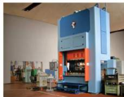
Lisování - stříhání a hohybání, hluboké tažení a protlačování