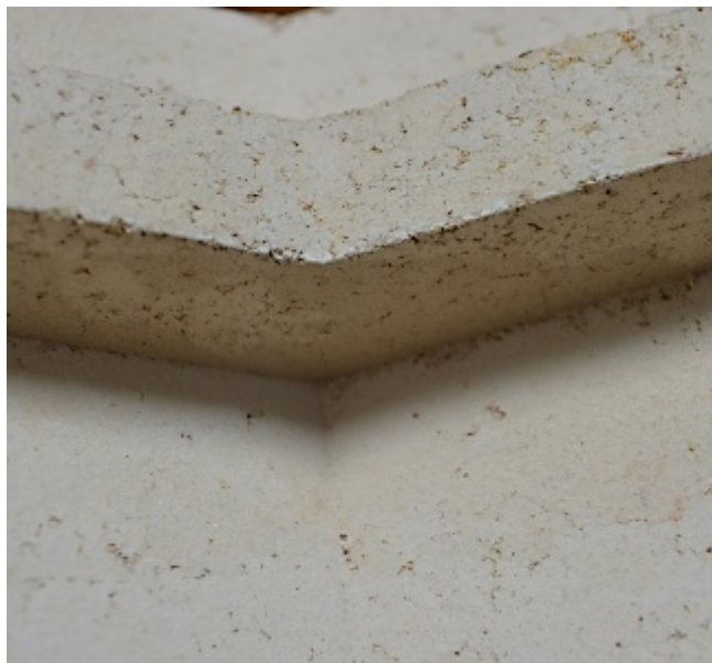
Omítací akumulční šamotové tvarovky AKUMOL