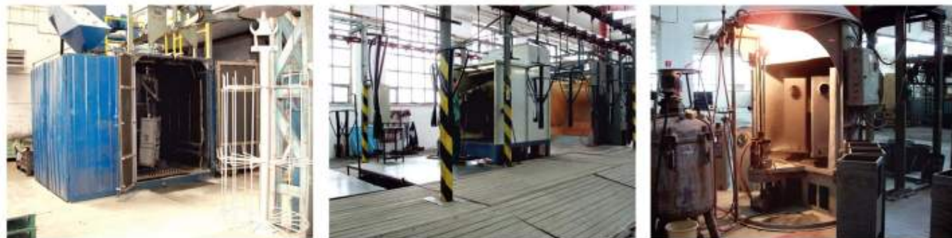
Pískování povrchu, galvanické pokovování a smaltování