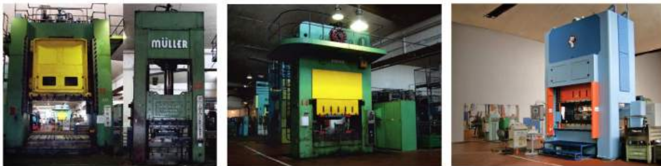
Lisování - stříhání a hohybání, hluboké tažení a protlačování