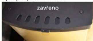
Výstup teplého vzduchu