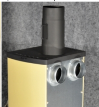
Připojení na komín a rozvod teplovzdušného topení