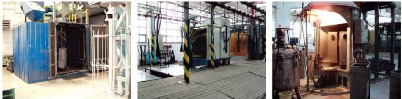
Pískování povrchu, galvanické pokovování a smaltování