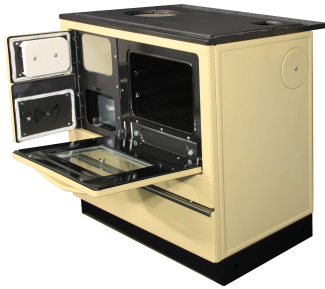
THORMA OKONOM 85 FIKO De Luxe - Pravy