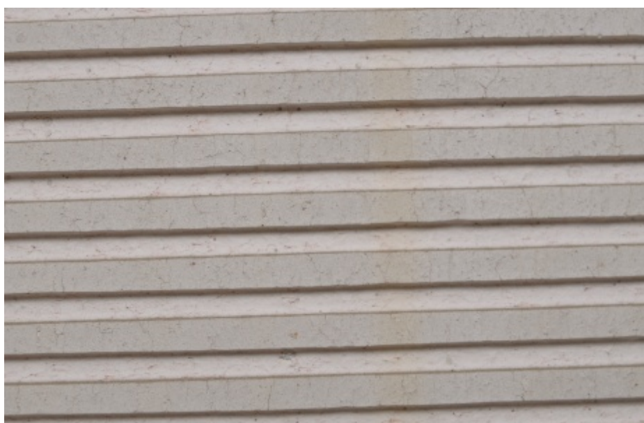
Póry působí v šamotu jako přirozený tlumič šíření napětí a jsou schopny ukončit narůstající trhlinu. Velikost