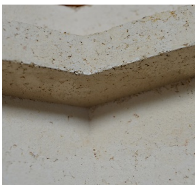
Omítací akumulční šamotové tvarovky AKUMOL