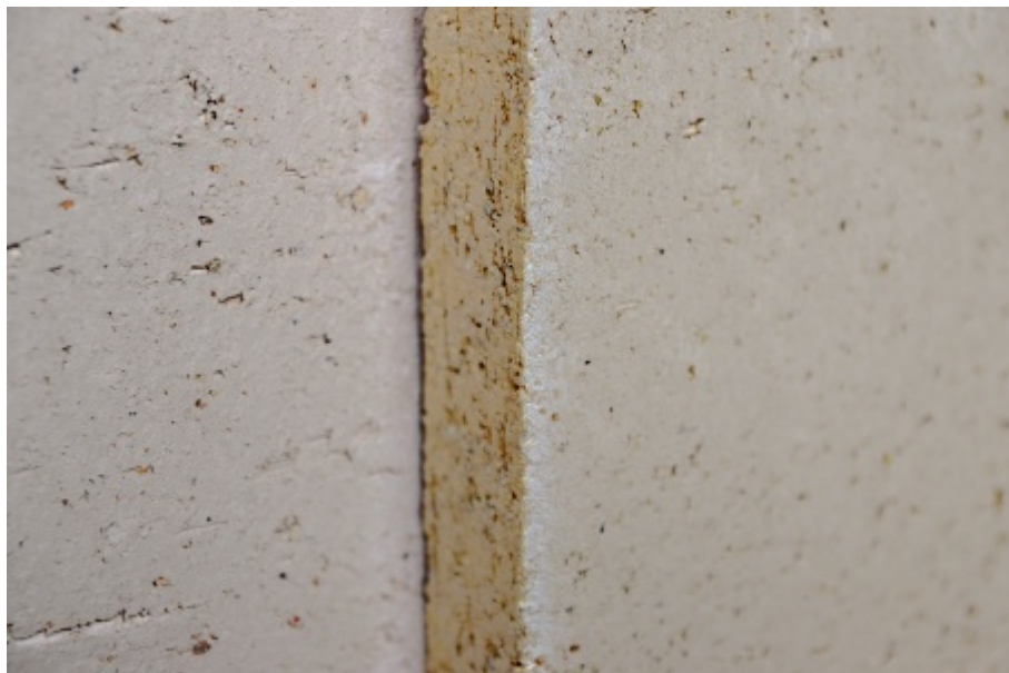
Lisované šamotové tvarovky